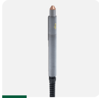
SKM 165 12M 022082