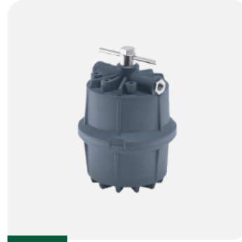
FILTRE À AIR COMPRIMÉ 427529