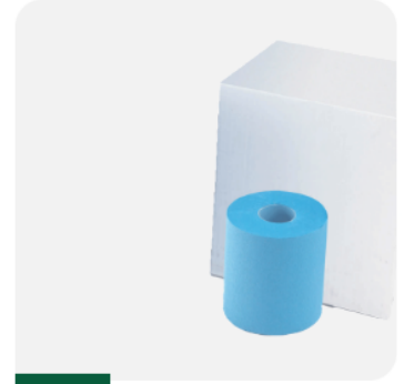
CARTOUCHES FILTRANTES 427530